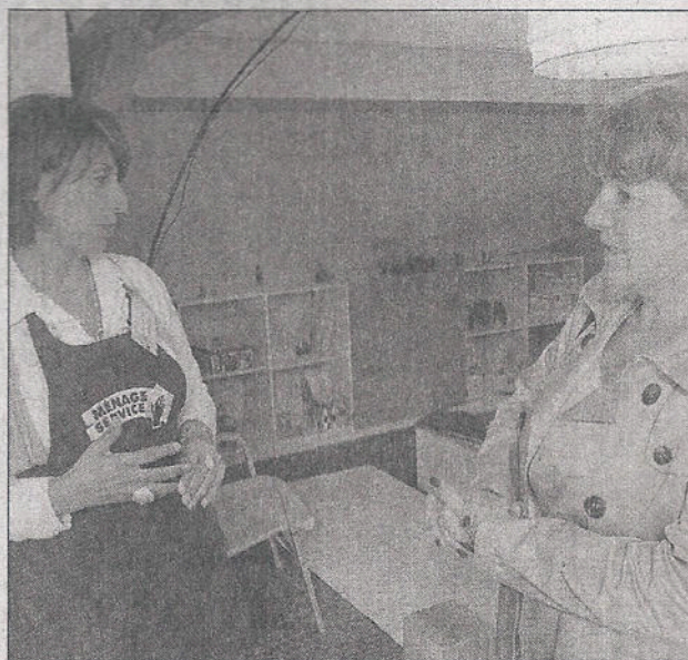
La professionnalisation du secteur des services à la personne a impressionné les clients